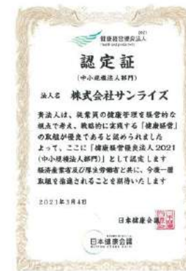
清流の国ぎふ健康経営宣言企業