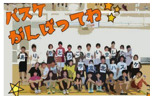
地域少年団へのスポーツドリンク支給